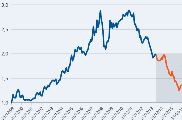
LA BOURSE CANADIENNE (S&P/TSX) COMPARÉE À LA BOURSE AMÉRICAINNE (S&P 500 EN $CAN) DU 1 er JANVIER 2000 AU 31 MARS 2016