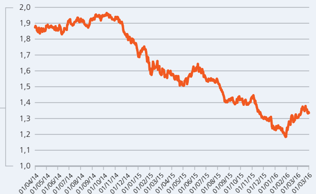
LA BOURSE CANADIENNE (S&P/TSX) COMPARÉE À LA BOURSE AMÉRICAINNE (S&P 500 EN $CAN) DU 1 er AVRIL 2014 AU 31 MARS 2016