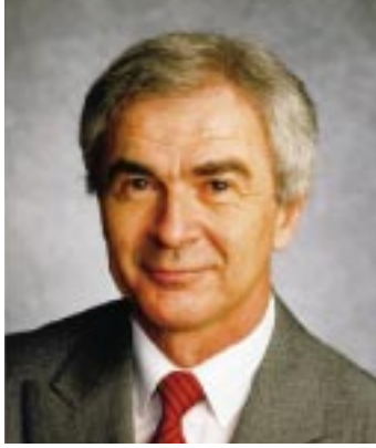
Docteur Renald Dutil Président Fédération des médecins omnipraticiens du Québec